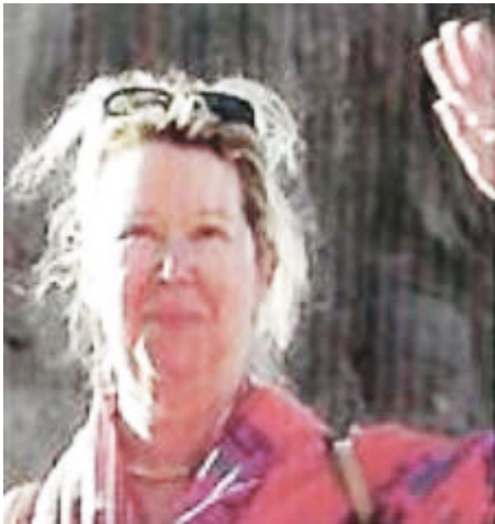
Françoise Avril – auteur

Mère de quatre enfants, et grand-maman de petits enfants, elle se passionne tout au long de sa carrière en tant qu'infirmière DE spécialisée en gérontologie, pour l'être humain dans toute sa splendeur et ses faiblesses. Elle parcourt le monde à la recherche de qui elle est et des mystères du monde.